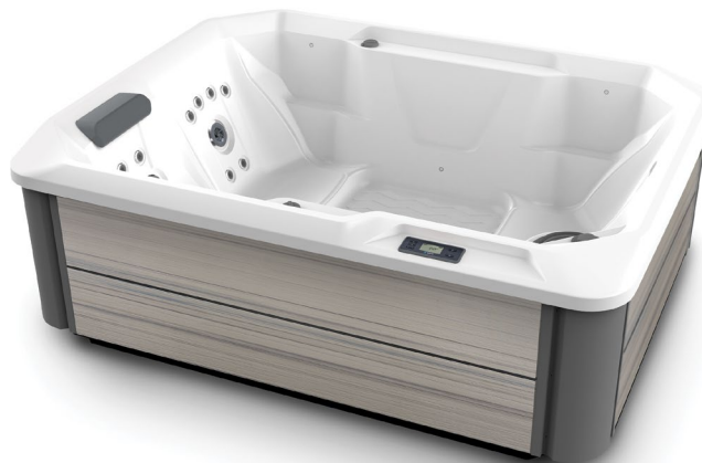
Stride spa shown with Alpine White shell and Almond cabinet.