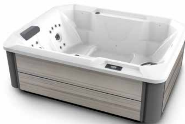
Modèle Stride avec coque Blanc alpin et habillage Amande.