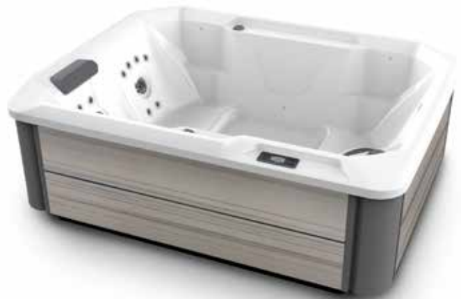
Stride con casco Alpine White y gabinete Almond